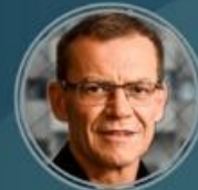
FABIANO CONTARATO Senador