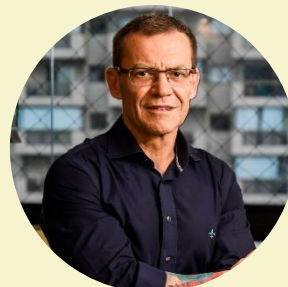
Senador Fabiano Contarato PT-ES