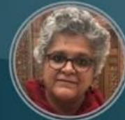
IZABELLA TEIXEIRA Ex-ministra do Meio Ambiente