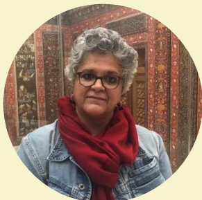
Izabella Teixeira Ex-Ministra do Meio Ambiente