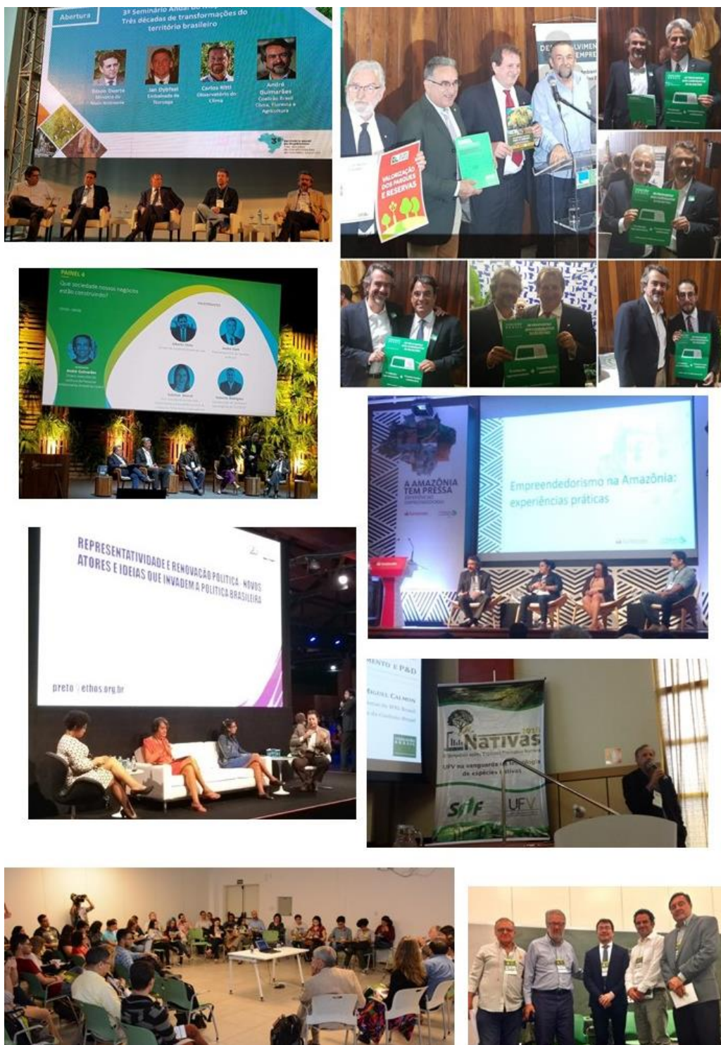
Figura 4. Apresentação e distribuição do documento eleições em eventos – Seminário anual do MapBiomas, Ato político “Desenvolvimento para sempre – compromissos ambientais prioritários às eleições 2018”, Sustentável 2018, A Amazônia tem pressa, Conferência Ethos São Paulo 2018, II Simpósio sobre Espécies Florestais Nativas e I Congresso de Gestão da Amazônia – AMAS.