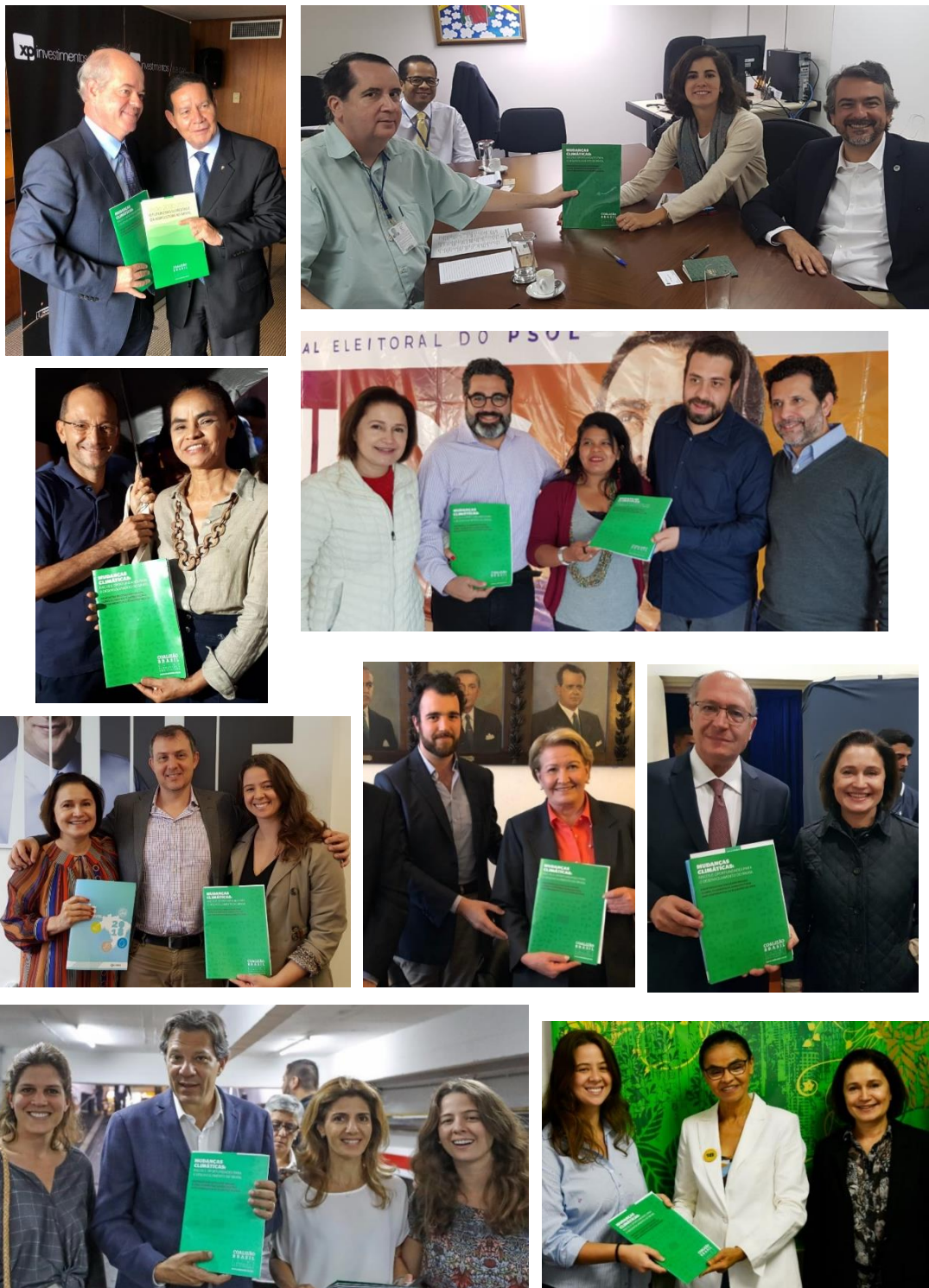
Figura 1. Entregas do documento eleições aos presidenciáveis em 2018 e seus representantes - General Hamilton Mourão, assessoria do Álvaro Dias, Marina Silva, Ana Amélia Lemos, Guilherme Boulos e Sônia Guajajara, Fernando Haddad, Geraldo Alckmin e Nelson Marconi (coordenador do plano de governo do Ciro Gomes).