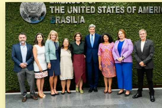
28/02: Encontro John Kerry e sociedade civil